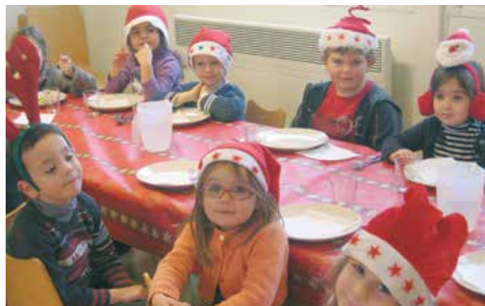
Repas de Noël