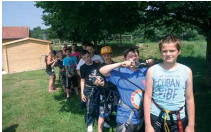
Ados à l'acrobranche de Moineville

Le thème de Jules Vernes a ponctué la première semaine : en découvrant l'univers du fantastique, grâce à l'ouvrage « voyage au centre de la terre », les enfants ont laissé libre court à leur imagination et à leur créativité, dans l'écriture d'histoires pour le spectacle de fin de semaine. En parallèle 13 ados sont partis 3 nuits à la base de loisirs de Moineville, où ils ont pu pratiquer des activités comme le kayak, de l'acrobranche et du street hockey.