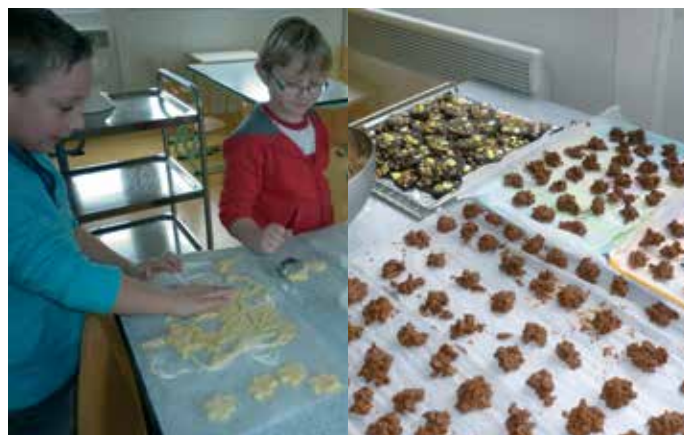
Confection de gâteaux, et confiseries pour Halloween