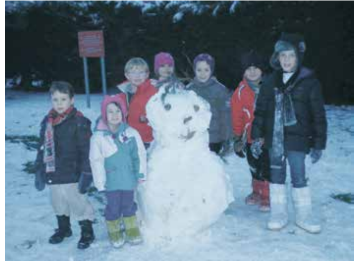
Bonhomme de neige au périscolaire

Soit une moyenne de 14 enfants pour le matin, 54 enfants pour le midi et 19 enfants pour le goûter.