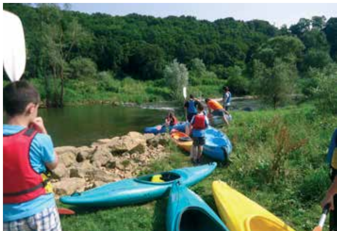
Kayak à Moineville

La deuxième semaine fut rythmée par le thème des pirates et par 3 nuitées sous tentes à Pournoy-la-Grasse. 38 enfants se sont succédés sur les trois nuits proposées. Pour le repas du soir, les enfants ont préparé soit des pizzas à leur goût (avec ou sans : jambon, champignons, tomates, gruyère, chèvre, chorizo, poivron et mozzarella), soit des croque monsieurs.