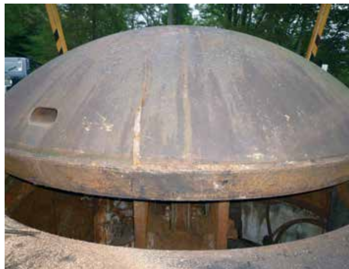
Tourelle pour canon de 10 cm