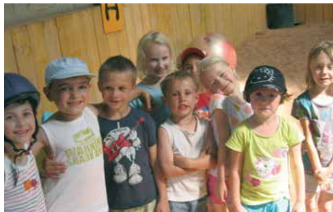
Equitation à Pournoy

Une sortie au parc Walygator avec 60 enfants et une sortie au zoo d'Amnéville avec 61 enfants furent organisées lors de cette session.