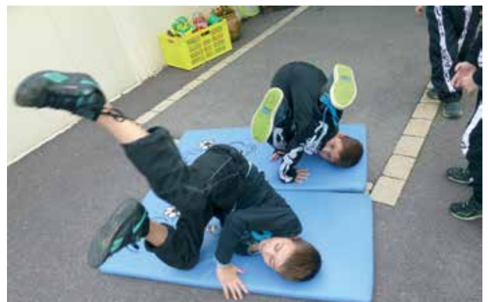
Hip-hop des enfants

2 de 10h à 17h 30, notamment pour la confection du cadeau de la fête des Mères