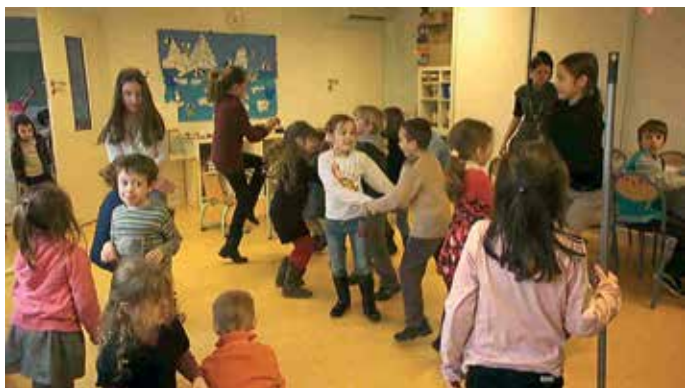
Danse endiablée au périscolaire